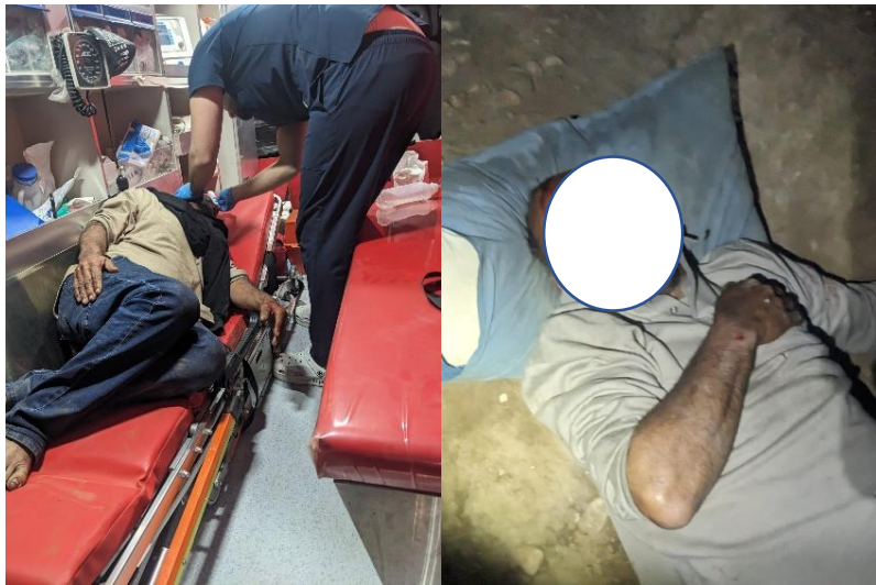
טיפול בפצועים בעין אל חילוה, 30.4.2026

113. בליל 30.4.2026 תקפו שלושה מתנחלים את משפחת [REDACTED] בביתה, בעין אל חילוה. המתנחלים פצעו את אב המשפחה בראשו ובידו, הכו את בנו באלות, וריססו כמה מבנות המשפחה בגז פלפל. שלושה מתושבי המקום פונו לבית החולים. אב המשפחה אושפז למשך שבועיים ונזקק לניתוח. נערכה קריאה למשטרה. שוטר שהתייצב במקום כשעה לאחר סיום האירוע, הציע לתושבים שהותקפו להגיע לתחנת המשטרה ולהגיש תלונה, ולא עשה דבר כדי לאתר את התוקפים.