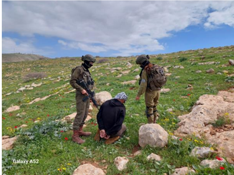
רועה ממשפחת בשאראת במכחול מעוכב על ידי חיילים רעולי פנים, 19.2.2025

25. בדומה למשפחות אחרות בשל מגבלות התנועה, תושבי מכחול אינם יכולים למכור את מוצרי החלב בעונות החליבה האחרונות. בעבר, הובלת החלב לטובאס וטמון על ידי מוביל עלתה עשרות שקלים בודדים. כיום עלות ההובלה הוכפלה פי חמישה ויותר, בשל הכורח להמתין שעות ארוכות במחסומים, וחוסר הוודאות באשר ליכולת לעבור טרם סגירת המחסום. בשל היעדר תשתיות חשמל, אין בקהילות פתרונות אחסון וקירור לגבינות שהצטברו. לכך מתווספות עלויות המים המאמירות, והכורח לקנות מזון לצאן, כאשר אלימות המתנחלים והתעמרות הצבא אינם מאפשרים יציאה למרעה.