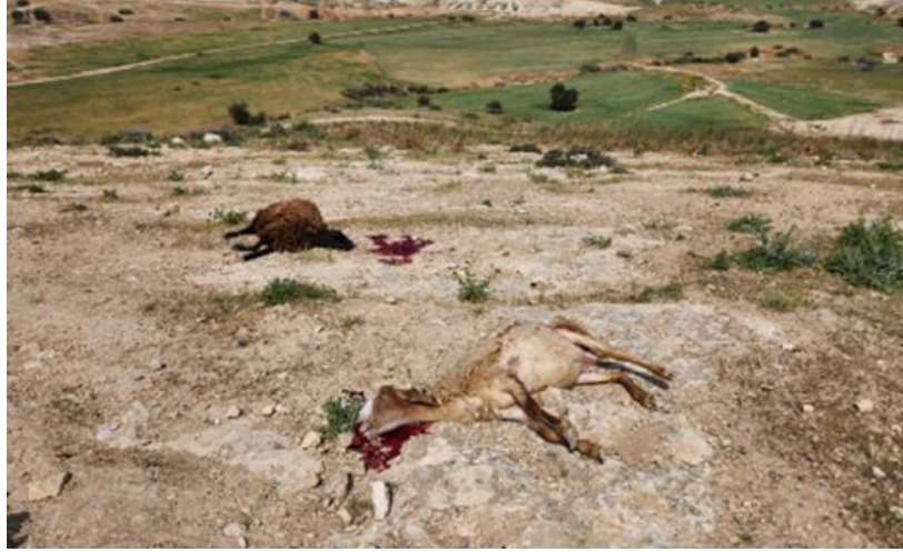
כבשים שנמצאו ירויות בשטח לאחר האירוע מיום 28.3.2025