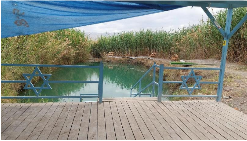
מעיין בכפר עין אל ביד'א שהוסב לאתר תיירות עבור ישראלים

תלות בהסדרה תכנונית. מאחז אורי כהן אף מציע למבקרים בריכת שחייה הנמצאת בתוך אחד המבנים במאחז. אין מחסור. 2