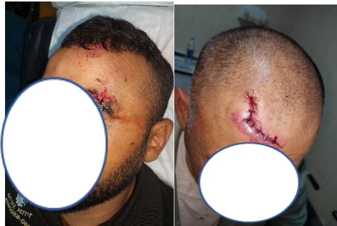
העותר 14 ובנו לאחר תקיפתם