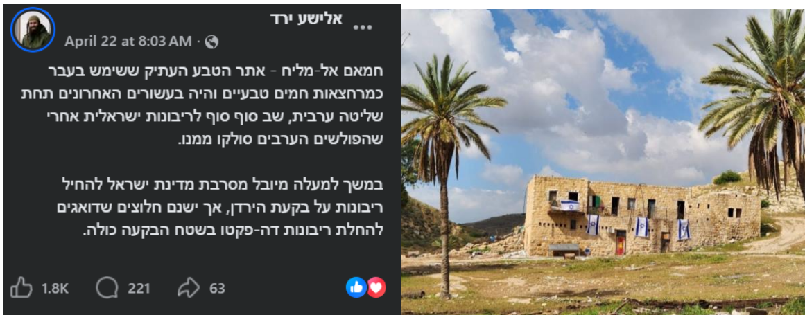
פרסום ברשתות החברתיות בעקבות ההשתלטות על בתי התושבים – חמאם אל-מליח

65. ברשתות החברתיות הוכתר המקום כאתר ששוחרר מידי "האויב" והוחזר לידי עם ישראל, כחלק מהחלת "ריבונות דה פקטו" בגדה. המועצה המקומית ערכה סיורים במקום למטיילים בחג פסח, מיד לאחר הגירוש. ביום 21.4.2026 הוחרב מבנה בית הספר של הקהילה על ידי מתנחלים. מעט לאחר מכן, הוצב מגן דויד גדול על גג אחד ממבני המגורים העתיקים במקום, ודגלי ישראל הונפו מכל חלונותיו.