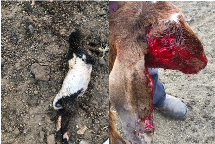
כבשים שנדרסו באירוע מיום 14.11.2025

102. ביום 14.11.2025, בשעות הצהריים המוקדמות, פלשו צעירים ישראלים למתחם המגורים של קהילת סמרה, איימו על התושבים, שוטטו במתחם הקהילה בטרקטורונים, ואגב כך דרסו ורמסו מספר טלאים וכבשים. האירוע דווח לצבא.