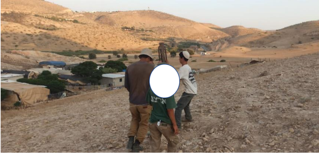
הקמת הגדר בצמוד לקהילת פארסייה

הפתוחים בכיוון היחיד שאינו מחייב כניסה אל שטח אש. ביום 10.11.2025 הציבו צעירים ממאחזי האזור גדרות נוספות, מול מתחם המגורים של הקהילה, המונעות את חציית כביש אלון מזרחה. מעבר לגדרות אלה מצויות חלקות חקלאיות פרטיות שאותן חוכרים תושבי הקהילה, שטח חקלאי מישורי מצומצם שאינו בתוך שטח האש, סמוך להתנחלות רותם ולמאחז של משפחת עמוסי. כפי שנראה בהמשך הדברים, גם לאדמות אינם יכולים להגיע כעת.