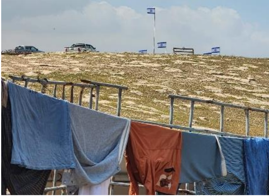
נקודת ישיבה ותצפית מעל בתיהם של תושבי חדידיה