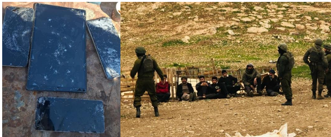
מימין, רועי קהילת חדידיה מעוכבים לאחר שהותקפו בביתם; משמאל: מסכי הטאבלטים והטלפונים של התושבים מנופצים

108. ביום 2.3.2026 החלה פשיטת מתנחלים אלימה ונרחבת על מתחמי המגורים של קהילת חדידיה. עשרות מתנחלים נאספו מהאזור כולו, פלשו לחצרות ולבתים בהם שהו נשים, נערות וילדות לבדן, תקפו תושבים פיזית וריססו אותם בגז פלפל, ופגעו במכלי המים וברכוש. מכשירי טלפון נתפסו ורוסקו על מנת להשמיד תיעוד. הצבא הגיע למתחם המגורים של הקהילה בכוחות גדולים, ומעשי האלימות נמשכו בנוכחות החיילים, שלא פעלו כדי להרחיק את הפורעים מהמקום, ולא עיכבו ולו אחד מהם. שבעה תושבים עוכבו בסיום האירוע על ידי הצבא. כולם שוחררו בלא כלום בחלוף מספר שעות.