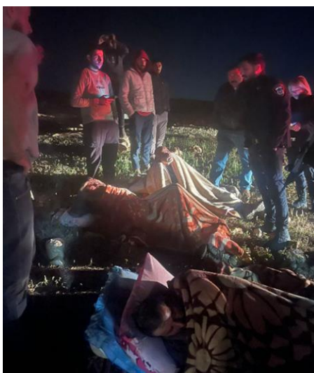
טיפול בפצועים לאחר הפוגרום בחומסה, 13.3.2026

109. ביום 13.3.2026, בעיצומו של חודש הרמדאן, שרדה קהילת חומסה פוגרום לילי אלים וקשה ביותר. עשרות מתנחלים רעולי פנים פשטו על מתחם המגורים, כלאו את בני המשפחה ואזקו את חלקם, הכו ובעטו בהם - מילדות רכות בשנים ועד קשישים. הם איימו על ההורים כי אם לא יעזבו את מקום מושבם, ייקחו מהם את ילדיהם. בעת שחלק מהפורעים עסקו בהתעללות פיזית, אחרים פרצו את דירי הצאן, העמיסו על משאיות וגנבו עדר בן כ-350 ראש. בהמשך לאירוע זה נפתחה חקירה משטרתית. ידוע שנעצרו חשודים בודדים בלבד, ושוחררו עד תום ההליכים. עדר הצאן של המשפחה לא נמצא ולא הוחזר לידיה. התושבים נותרו ללא עיסוק וללא מקור פרנסה, כשהם תלויים בנדבות מזון, ומחשבים את קצם הכלכלי לאחור. כל התושבים כולל הילדים סובלים מההשלכות הנפשיות הקשות של האירוע.