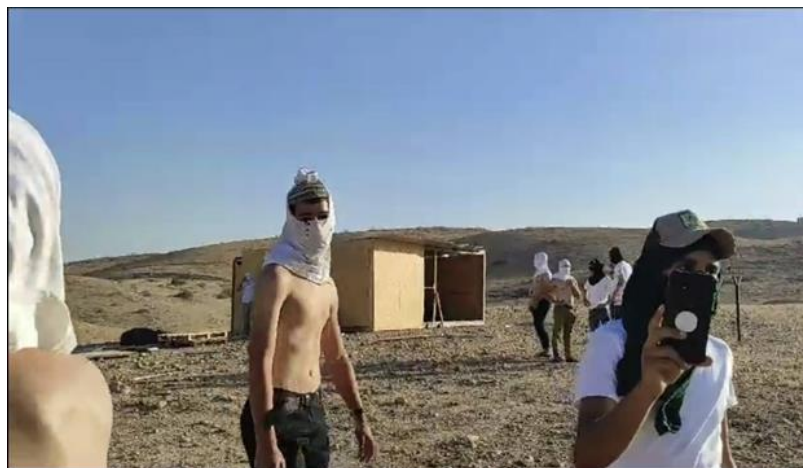
נערי שדמות מחולה באירועי תקיפה של רועי פארסיה