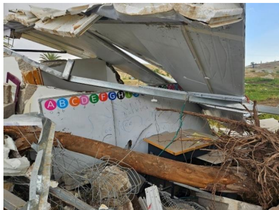
הריסות בית הספר